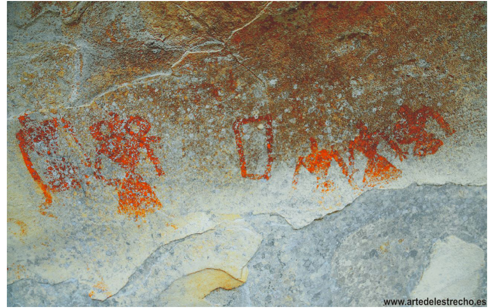
Fig. 5. Detalle del Abrigo Tajo de los Albarianos, “arte de laguna de la Janda”. Fuente: www.artedelestrecho.es . Fig. 6. Detalle de la cueva de las Mujeres. Fuente: www.artedelestrecho.es .

Al superponer sobre este medio natural el patrimonio prehistórico observamos que el mismo sigue una lógica de implantación, ya que los abrigos y cuevas con pinturas rupestres se sitúan aprovechando las afloramientos rocosos a lo largo de las alineaciones serranas, en lugares prominentes y dominando por tanto los valles fluviales, en definitiva las zonas productivas, de caza o pesca, así como los pasillos de comunicación, esta especial relación de los abrigos con el paisaje será fundamental en la propuesta que realizaremos.