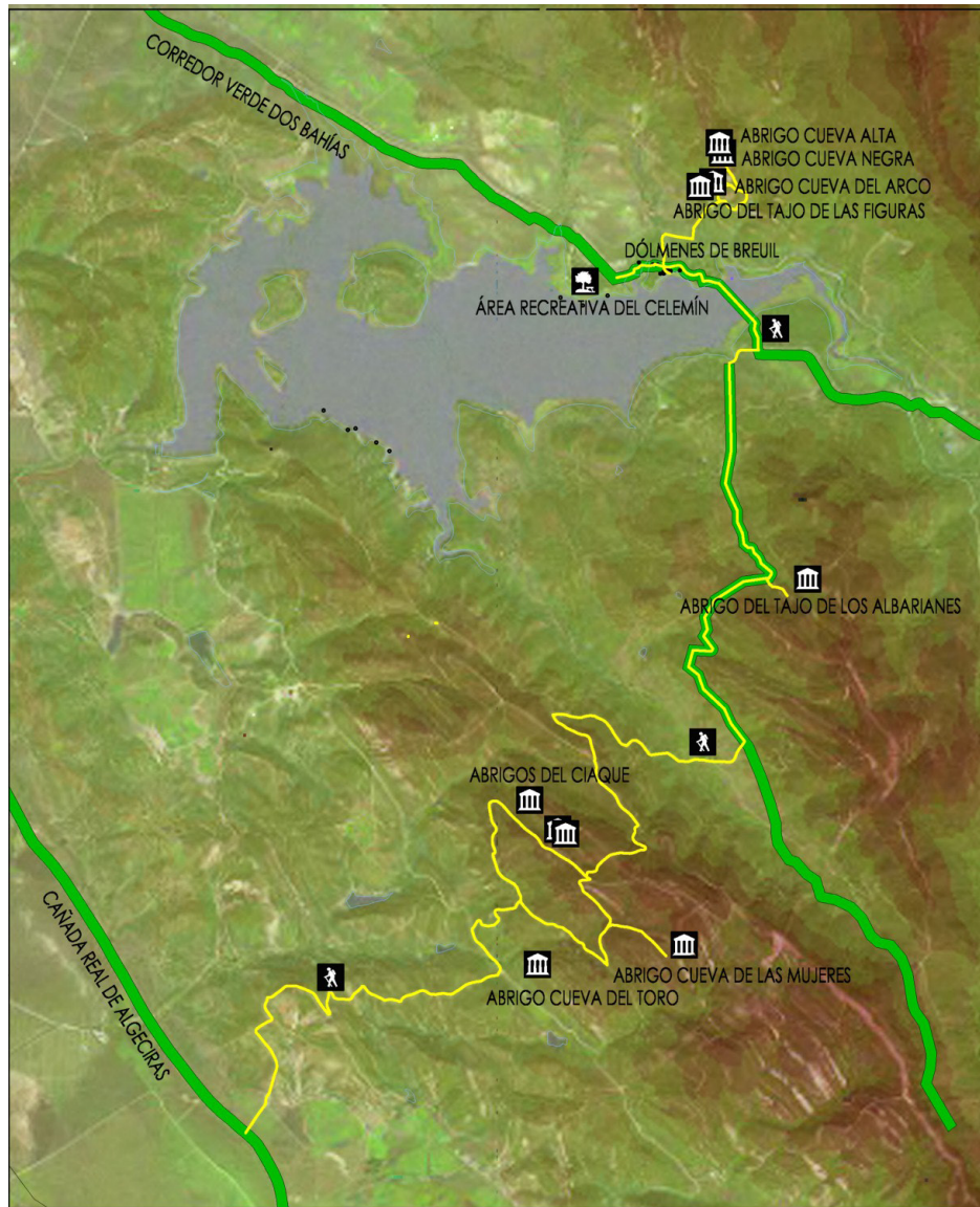
Fig. 7. Recorrido del Itinerario Cultural.

en la Garganta de la Cañada del Valle hasta su tramo medio, donde se abandona para subir y atravesar directamente la cadena de cerros que lo separan de la antigua laguna de la Janda, es en estas estribaciones, perteneciente a Sierra Blanquilla, donde se sitúa el segundo conjunto de abrigos, el formado, entre otros, por el Abrigo de la Cueva de las Mujeres. Desde el mismo la ruta se prolonga descendiendo hasta su conexión, ya en el límite del Parque Natural, con la Cañada Real de Algeciras, en el entorno de la antigua laguna de la Janda, con idea de potenciar la relación entre dicho patrimonio y la antigua laguna, que estuvo en el punto de partida de este trabajo.