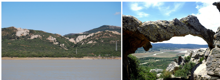
Fig. 3. Vista del embalse del Celemín y Sierra Momia lugar donde se encuentra el conjunto rupestre del Tajo de las Figuras.